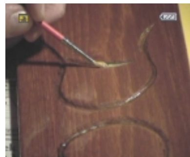
Het aanbrengen van de lijm is cruciaal: het plakt enorm en dus komt overal waar lijm zit ook bladgoud. Dat vergt een vaste hand..

oefenen en hopelijk kan het (fraaiere) resultaat worden bewonderd tijdens onze meeting! Henk de Vlaam (wordt vervolgd)