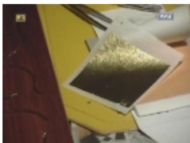
Een velletje dubbel torengoud op vloeï. 8 x 8 cm, vreselijk dun en kwetsbaar.

vertelde dat hij het bladgoud had gekocht in Amsterdam en beloofde het adres te sturen.