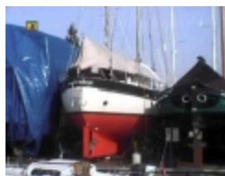
Nog even en dan .....