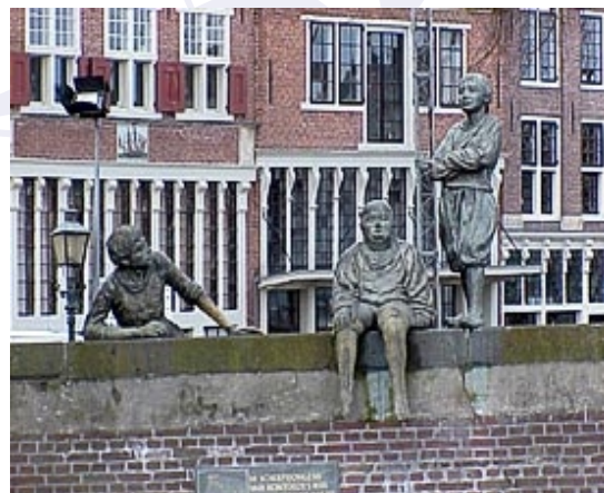
De beroemde Scheepsjongens van Bontekoe