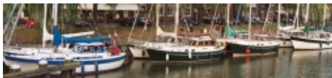
Derde meeting, oktober 2002 in Enkhuizen