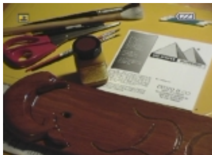
De benodigdheden: bladgoud op vloeï, Instacoll lijm, penselen, mesje, geduld

Het adres voor professioneel bladgoud en bijbehorende lijm: Duller & Co, v Oldebarneveldstraat 82, 1052KG Amsterdam 020-6842332