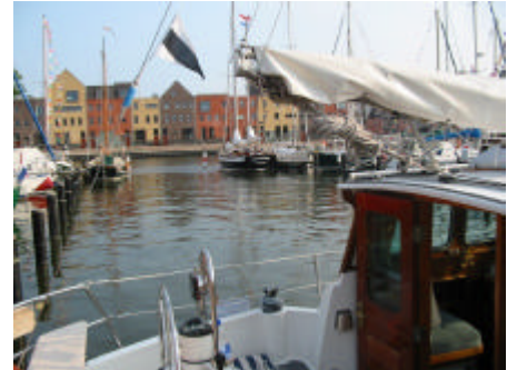
De nieuwbouw appartementen langs de havenkom maken een Scandinavische indruk