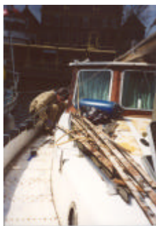
Alles werd grondig van het dek gesloopt