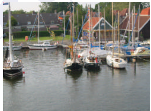
Clubhuis van WSV Karperskuijl met enkele deelnemende Dartsailers.