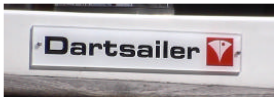
Nieuw typeplaatje: niet van echt te onderscheiden!