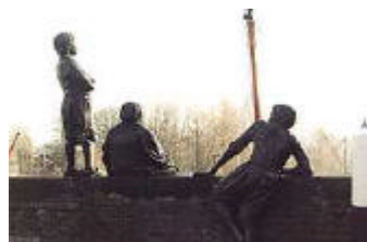
Beeld van de Scheepsjongens

De gids vertelde ons vol vuur over de rijke historie van Hoorn. Wij hingen aan zijn lippen en stelden vragen waarop ons dankbaar een antwoord werd gegeven. We gingen langs prachtige herenhuizen, het waarschijnlijke geboortehuis van Bontekoe en ook