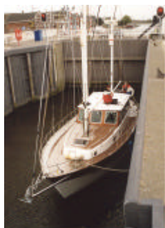
Het werk aan de SHANTY is al aardig gevorderd