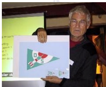
Leo met het gekozen ontwerp

In Hoorn kochten vrijwel alle deelnemers een of meer