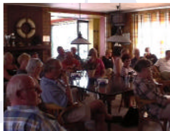
Aandachtig luisterend naar de diverse presentaties

werd besloten dat deze vier personen gezamenlijk de vijfde meeting zullen gaan opzetten.