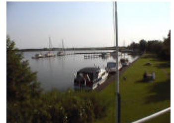
Prima aanlegplek op het verenigingseiland in het Alkmaardermeer.

maar dat wordt ruimschoots gecompenseerd door een mooi wandelgebied en veel prima zwemen viswater.