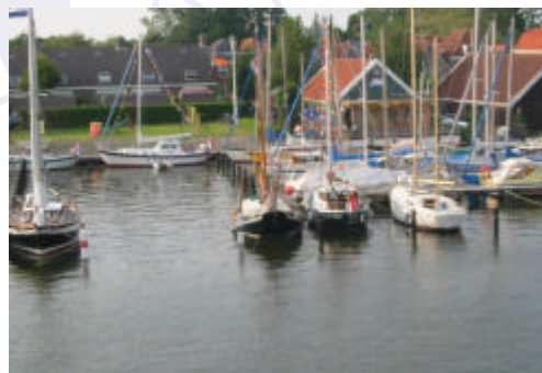
Clubhuis van WSV Karperkuijl met enkele deelname Dartsailers, 4e meeting mei 2003.

Meld je dan voor 25 september aan bij Evert of Marijke van Essen: per mail: essenvan.e@planet.nl of telefoon: 075-6162040