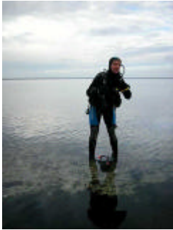
Voor liefhebbers van duiksport is de Grevelingen een waar paradijs