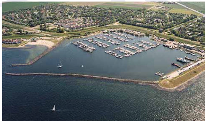
De haven van Den Osse