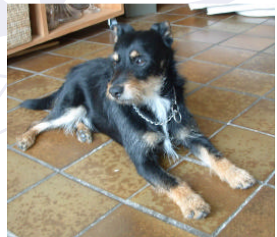
Onze nieuwe redacteur