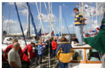
Palaver met de deelnemende schippers en partners.