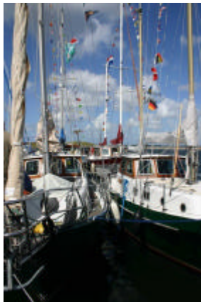
De Doggersbank en de Pinta naast elkaar in Den Osse

Een Goerees understatement voor een uitgebreid en smakelijk diner, geserveerd door een paar leuke dames en met een goed glas erbij.