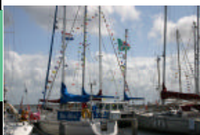
Versierde schepen en de nieuwe Dartsailervlag (midden boven)

Na een uur zeilen maak ik nog deze laatste foto van een Dartsailer 30.