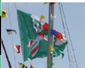
De nieuwe Dartsailervlag