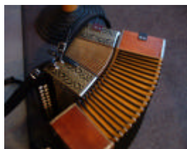
Een paar trekzakken rusten even uit van de inspanningen