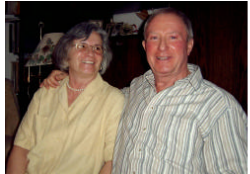
Vom Wasser nicht mehr fortzuprügeln !

Dort unternahmen wir dann Tages- und Nachtreisen zu den einzelnen Inseln.