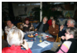
Het was ook erg leuk om elkaar weer eens te zien en nieuwe leden te leren kennen.

Met een uitstekende beschrijving in de hand waar de haven van de watersportvereniging van Almere is, rijden we vanuit het Noorden op zaterdagmiddag de 29 e januari vol verwachting richting Almere.