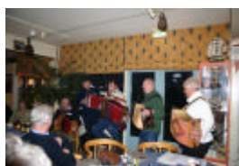
Het hele orkest geeft een demonstratie