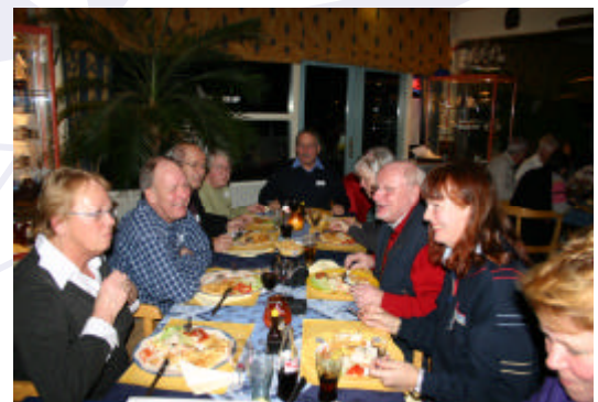
Genieten van de heerlijke maaltijd, verzorgd door de clubhuisbeheerders van WSV Almere-Haven