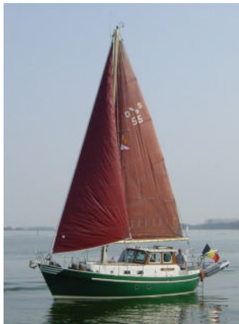
De Happy Dart tijdens zwaar weer