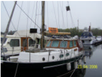
De Xarifa zoals deze in Emmerich te koop lag