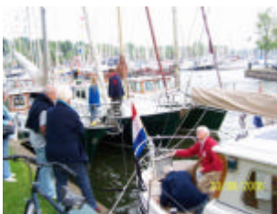
Sfeerplaatje van de 12e meeting in Medemblik