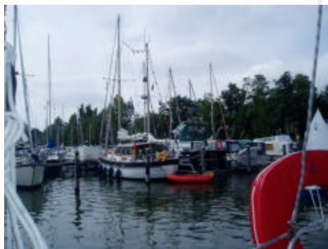
De WALTA tijdens de afgelopen zomermeeting