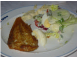
Visbak tijdens meeting 13 in Arnhemuiden