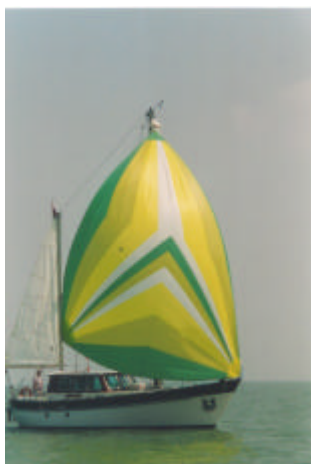
De DOLFIJN met een fraaie gennaker

Laat je voorkeur voor een of twee datums weten, met hoeveel personen je dan denkt te komen plus eventuele andere suggesties.