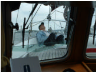
Relaxed de genua in de gaten houden