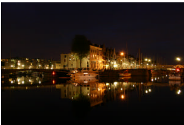
Windstille avond in Middelburg