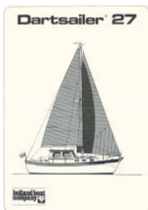
Voorpagina van originele Dartsailer folder