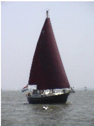
De PINTA met nieuwe zeilen

U wordt op de hoogte gehouden van de vorderingen!