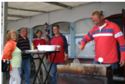
De visbak expert bakt ze bruin

Een aantal leden van de WSV bakten op hun vrije zaterdagavond vele kilo's vis die door de leden van de Dartsailerclub met smaak werden verorberd.