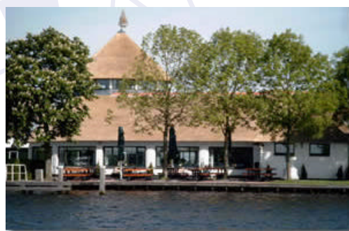
Niet zomaar een clubhuis, maar een SOCIËTEIT!