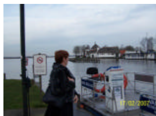
Schipper, mag ik over varen? Op de achtergrond de fraaie sociëteit