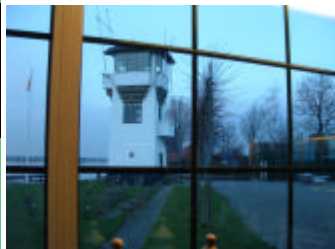
De bekende startoren, gezien vanuit een ongewone hoek