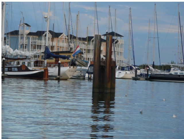
Wat doet zo'n paal ook in het midden van de haven?

Toen we de Heliushaven weer invoeren gebeurde het. Ondergetekende stond aan het roer maar had had meer aandacht voor de mensen aan de wal die stonden te zwaaien.