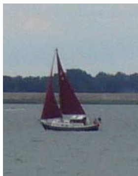
Een van de deelnemers aan de zeilwedstrijd.

Veel liefs, Céleste van de WALTA (4,5 jaar)