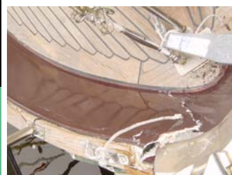
Ook de binnenkant is gekneusd