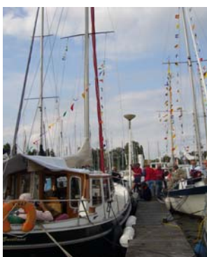
De VIVAT (links) en de MAATJE tijdens het palaver op de steiger