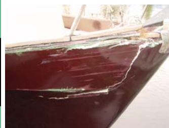
Gelukkig is een deel van de klap opgevangen door schampen langs de paal. Iets meer naar SB en de schade was nog veel ernstiger geweest.