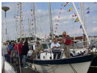
Palaver bij de MAATJE met treksakmuziek op het voorschip

Het was al in de vroege uurtjes toen de laatste feestgangers het clubhuis verlieten.