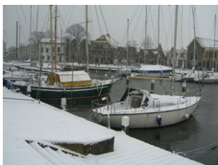
Winter 2007 in Middelharnis