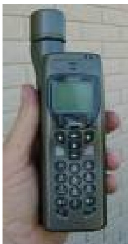
Zo handzaam is tegenwoordig een iridium satelliet telefoon