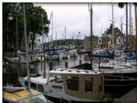
Middelharnis: schilderachtig haventje op het Zuid Hollandse Goeree-Overflakkee.