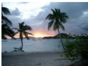
Wie droomt daar niet van?