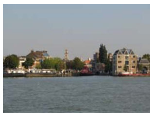
De toegang van de haven in Dordrecht, gezien vanaf de drukste kruising van waterwegen in ons land.

Tot nu toe zijn er 91 inschrijvingen genoteerd. Daarvan hebben in de loop der tijd 8 leden hun schip verkocht en dus het lidmaatschap opgezegd. Het ledenbestand bedraagt nu 83 leden, waarvan 79 met een Dartsailer of Sirocco. Verder 1 aspirant lid en 1 lid (Werf De Wijde Blick) welke in het bezit is van de bouwmallen van de