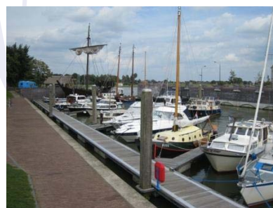
Zicht op de Kamper haven met koggeschip