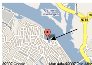
De haven van WSV "De Buitenhaven". De pijl wijst naar de juiste havenkom.