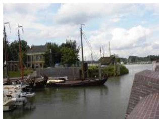
De buitenhaven vanuit een andere hoek gezien met zicht op de Koggewerf