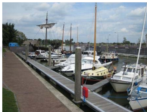
De jachthaven van Kampen.

Watersportvereniging "De Buitenhaven" vindt u, gerekend vanaf het IJsselmeer, aan stuurboord zijde van de IJssel meteen na de Koggerwerf en vóór de IJSELBRUG.