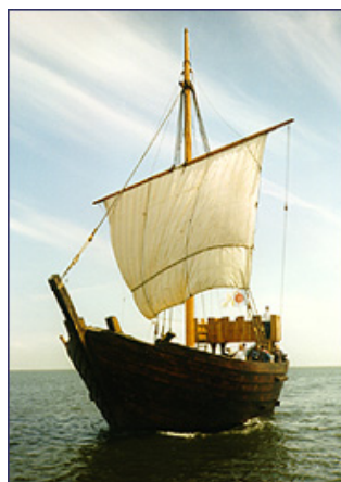
De Kamper kogge onder zeil