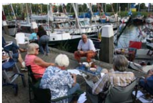
Sommigen namen er wel erg hun gemak van tijdens het palaver!

In een eerder verslag van een meeting is gesproken over een beproefd concept, een ieder kan in alle vrijheid kiezen wat hij of zij leuk vindt. Dit concept werkt nog steeds prima, het ongedwongen karakter van zo'n meeting komt de sfeer dan ook zeker ten goede.