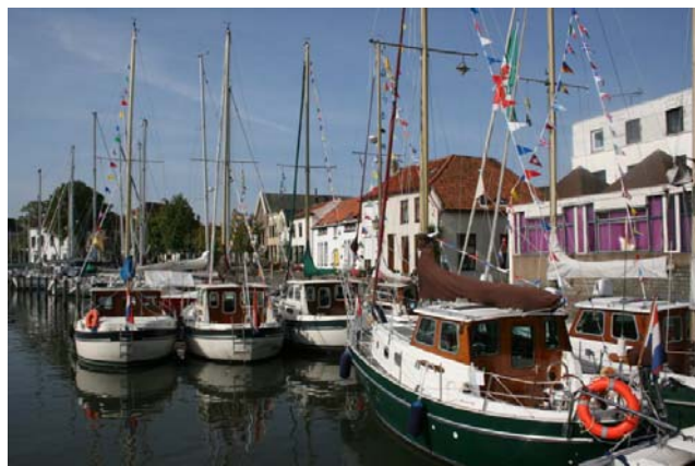
Beeld van de 19e meeting in Middelharnis

Het is in een uitvoering met een achterkajuit. Het schip is door de vorige eigenaar voorzien van een houten wand met schuifdeur in de