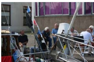
Palaver: altijd leuk als het weer meewerkt