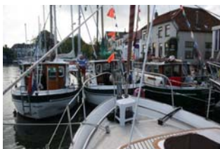
De deelnemende Dartsailers in de haven van Middelharnis gebroederlijk bij elkaar

Zaterdag 18/8, na het palaver kon een ieder het gezellige Middelharnis bekijken (of even bij komen) en 's middags nogmaals onder leiding van een gids. Dit was echt interes-