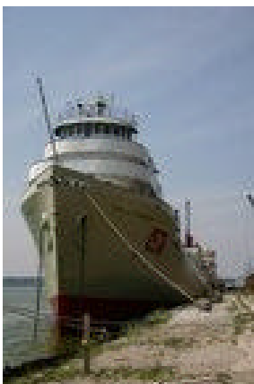
Typische Great Lakes vrachtaarder met de brug voorop om tijdens manoeuvres in de sluisen goed zicht te hebben op de nauwe invaart.