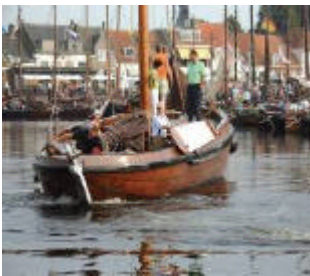
Historische botters in Elburg

Op de kaart hieronder het rode bootje links van de vispoort, dus bijna in het centrum van Elburg.