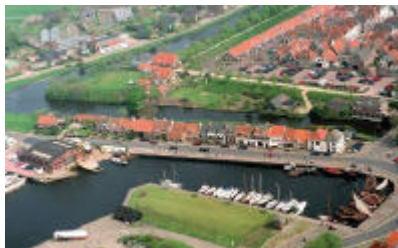
De havenkom van Elburg