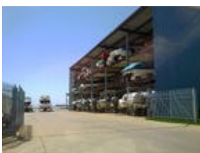
Botenstalling in een giga-stelling (Michigan, USA).