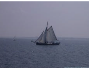
Oude Zeeuwse schuit op het Grevelingenmeer