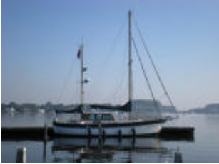
De WALTA ergens op de Grevelingen