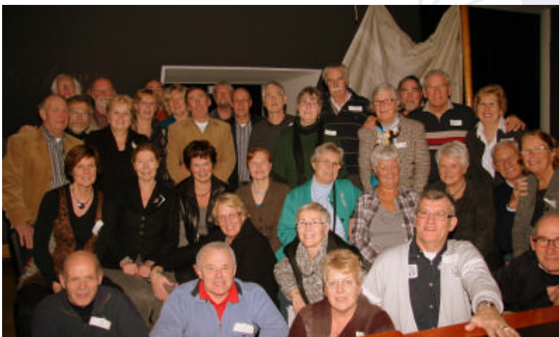
Het nemen van de traditionele groepsfoto van de Dartsailermeeting deelnemers was ook nu weer een leuke afsluiting