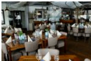
Interieur van Havenrijk

Bijdrage van Theo Polet, een van de deelnemers aan de wintermeeting in Uitgeest.