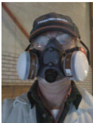
Waar ben ik aan begonnen!?

Na enig nadenken en veel lezen op internet, gevolgd door wat experimenteren, bleek dat het geen vocht was dat werd gemeten, maar staal in ballast. De vochtmeter sloeg behoorlijk uit, steeds als op plekken werd gemeten waar bij de nieuwbouw extra ballast was aangebracht! Vlak ernaast werd steeds droog laminaat gemeten als daar geen ballast achter de huid zat.