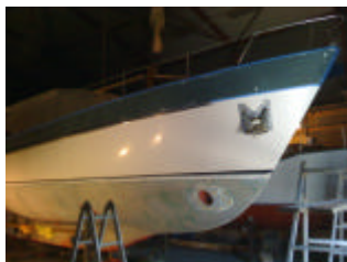
Geschild en droog, de behandeling kan beginnen

Eerst werd bij de aankoopkeuring (vermoedelijk ten onrechte) door een ANWB expert geconstateerd dat het laminaat van het onderwaterschip erg vochtig was. Daardoor was er een flinke kans dat op korte termijn osmose zou ontstaan. Bij het afsluiten van de koopovereenkomst werd daarom een flink bedrag als korting bedongen om het onderwaterschip vakkundig te laten behandelen.