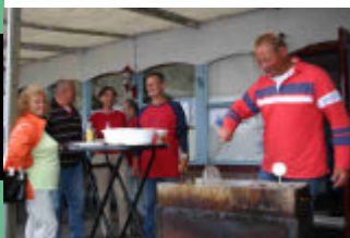
De heerlijke visbak, bereid door de leden van WSV Oranjeplaat voor hun gasten van de Dartsailerclub (meeting 13) Hopelijk ook deze keer weer op het programma?