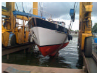
Eind goed al goed!

Uiteindelijk werd onze Dartsailer 1,5 jaar nadat deze was droog gezet in prima conditie weer te water gelaten. Op de website, in de rubriek Groot Onderhoud, is vrij kort daarna een uitgebreid artikel verschenen. Daarin is ook beschreven welke werkzaamheden in die periode nog meer zijn uitgevoerd, zoals het vervangen van de ballast in de kiel en het geheel opknappen van het lakwerk aan de buitenzijde van het stuurhuis.