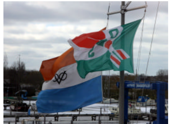
De Dartsailervlag wappert in een lekker briesje in de bevroren haven van Uitgeest tijdens de wintermeeting 2010