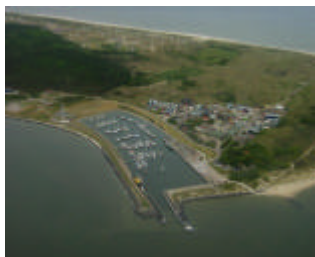
Haven Vlieland zoals deze eerst was

zich - voert tevens enkele mijlen over de Noordzee. Vlieland is hierin uniek.