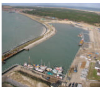
De haven van Vlieland toen de uitbreiding in volle gang was

Het is handig dat schippers die graag begeleid deze tocht willen maken dit kenbaar maken zodat er afspraken kunnen worden gemaakt over hoe, wat waar.