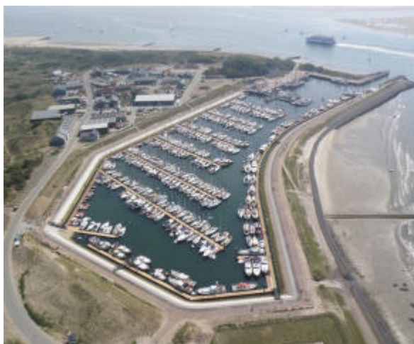
Zo ligt de haven van Vlieland erbij na de forse uitbreiding van het aantal ligplaatsen

Het programma voor deze pinkstermeeting 2010 kan er ongeveer zo uitzien: