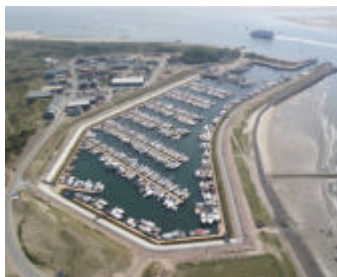
De haven van Vlieland, gezien naar het ZO