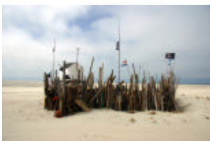
Het vroegere drenkelingenhuisje op de Vliehors; nu een knus juttermuseumpje op een indrukwekkende zandvlakte

De tweede dag hadden wij ons opgegeven voor een excursie met de Vliehors express. Later bleken er meer mensen van de groep mee te gaan. Een heel leuke excursie naar de grootste zandvlakte van Europa kennelijk. Veel zand dus, maar ook een klein museumpje in een heel klein reddingshuisje en tal van zeehonden, die jammer genoeg wel allemaal op een afstandje in het water bleven.