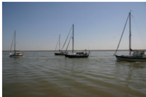
Konvooi naar Vlieland in de Boontjes bij vrijwel windstil weer.