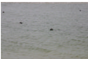
Zeehonden kijken op de Vliehors: tientallen kwamen nieuwsgierig naar de plek waar de truck stopte