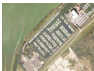
De haven van WV Lelystad