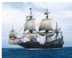
De Batavia onder vol tuig

Bij deze heten we deze nieuwe leden nogmaals van harte welkom bij de Dartsailerclub.