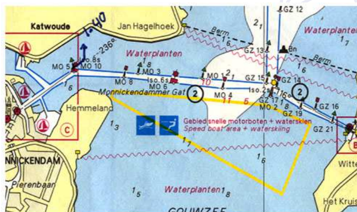
De bekende aanloop van Monnikendam in de ondiepe Gouwzee

De jachthaven Hemmeland is in het bezit van een prachtig stukje geschiedenis, namelijk het baken van het lichtschip "De Terschellingerbank" nummer 9. In 1933 is het gebouwd op de rijkswerf "Willemsoord" te Den Helder. Het was het eerste lichtschip waarbij de lichtopstand op het schip werd geplaatst middels een constructie van vier poten die rustten op de zijken van het schip. De voorgaande lichtschepen kenden een soort "lantaarnconstructie". Het lichthuis stond op een hoogte van 20 meter. Tijdens de tweede wereldoorlog deed het schip dienst als luchtafweerplatform door de Duitsers en werd door de Engelsen neergehaald. Na de oorlog werd het lichtschip weer hersteld op de werf en in 1948 weer in dienst gesteld.