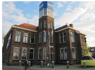
Zee- en Havenmuseum IJmuiden