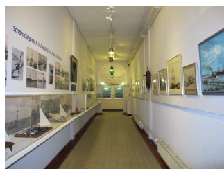
Museum interieur met modellen, schilderijen en andere interes- sante objecten