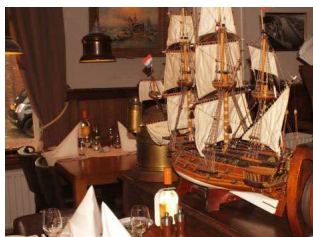
Passend nautisch sfeertje in De Meerplaats