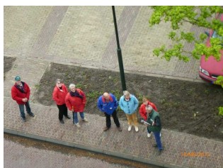
Het andere team gezien vanaf de toren