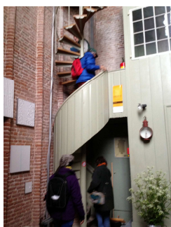
De torenbeklimming begon met een houten wenteltrapje