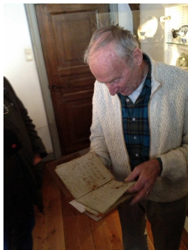
De gastvrije oude artiest toonde trots een honderden jaren oud handschrift dat hij tussen de bakbalken vond tijdens de restauratie van het huis