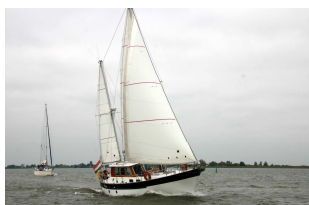
De DAME verlaat Monnickendam