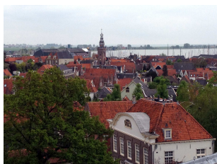
Schöne Aussicht auf Monnickendam und Hafen