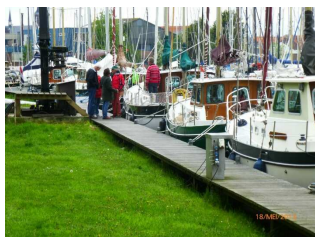
Even bijpraten op de steiger