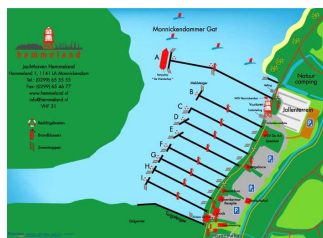
Jachthaven Hemmeland met aan de zuidzijde de steiger waar de Dartsailers konden afmeren