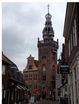
De toren met het ontzettend valse carillon waar de Monnickendamers nog trots op zijn ook!

stenaar van beroep die toevallig bevriend was met de stadsgids.