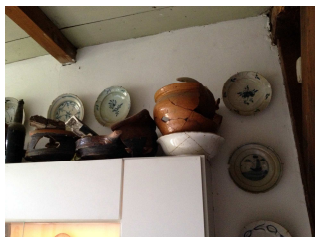
Enkele van de gevonden voorwerpen uit de diepe afvalput: minstens 350 jaar oud! Zo maar opgegraven in de tuin.