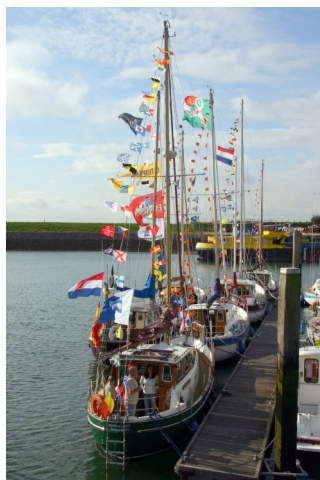
Sfeerbeeld van een vorige Zomer in Zeelandmeeting In Kats.

Vanzelfsprekend is het ook mogelijk om op eigen gelegenheid naar Vlieland te gaan. Ook in dat geval is aanmelden aan te bevelen, want dan kan daarmee rekening worden gehouden bij het bepalen van de benodigde ruimte.