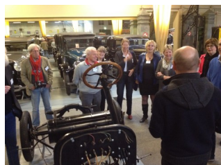
Leuke en interessante rondleiding

Na de koffie en gelegenheid tot bijpraten werd onder leiding van een enthousiaste gids een bezoek gebracht aan het museum.