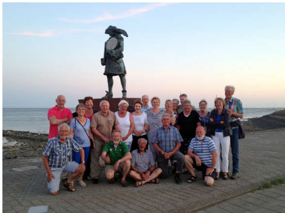
Deelnemers meeting Vlieland 2012

op de Waddenzee. Het voorlopige programma ziet als volgt uit: