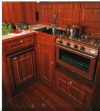
In de praktisch ingerichte L-vormige keuken kunt u ongevoerd de maaltijd bereiden. Er is voldoende ruimte om u alle te bezorgen.